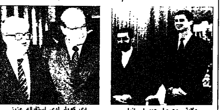
دي كويرل لدى استقباله عزيز

قال مصدر عراقي أمس أن وزير الخارجية العراقي طارق عزيز ونظيره الإيراني علي أكبر ولأيني سيجريان محادثات مباشرة في مقر الأمم المتحدة اليوم. وكان المصدر العراقي يتحدث بعد أن تلقى السيد عزيز مع الأمين العام للأمم المتحدة هانز بيير دي كويرل سيل تحويل الهدية السارية. منذ خمسة أشهر في الحرب الإيرانية العراقية إلى تصوية دائمة. وقال السيد عزيز للصحافيين دون أن يذكر تفاصيل أننا نتوقع معارفة من جانب الأمين العام غداً. أنه سيجتمع مع زميلي الإيراني وقد بلغته أنني ستكون رهن إشارته إذا أراد أن يراسي أو إذا أراد أن يرتب الاجتماع. وأضاف السيد عزيز قوله، إذا دعانا الأمين العام لاجتماع فإني ستكون على استعداد لاجتماع مع زميلي الإيراني. ولكنه قال أنه لا يعززم البقاء طويلاً في نيويورك. قال السيد عزيز، الذي اجتمع أيضاً مع السيد غاي براتاي وأنا سفير نييبل لدى الأمم المتحدة. الذي يرأس مجلس الأمن الدولي حالياً أن اجتماعاته السابقة مع السيد ولأيني كانت عقيدة إلى حد كبير. لا يمكنني أن أصفها بأنها كانت محادثات مباشرة حقيقية. وأضاف قوله، أن الجانب الآخر اختار أن يناقش في تلك الاجتماعات بدلاً